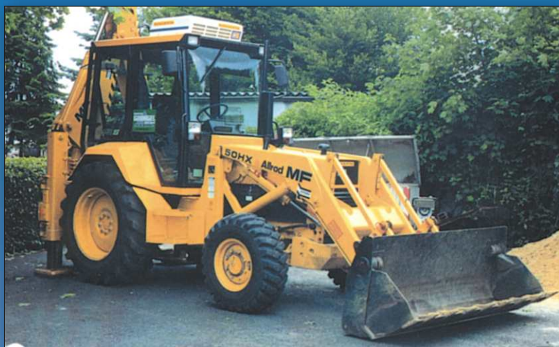
Klimatyzator KL 2C