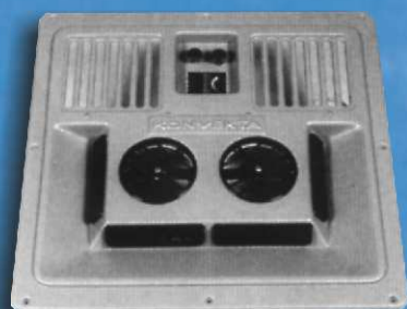
Płyta rozprowadzenia powietrza