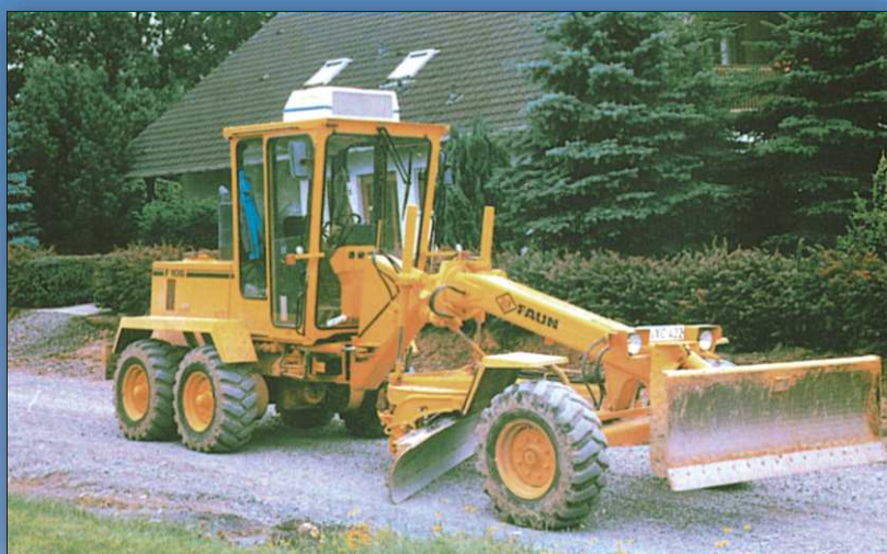
Klimatyzator KL 2AT