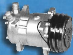
Sprężarka ze sprzęgłem elektromagnetycznym